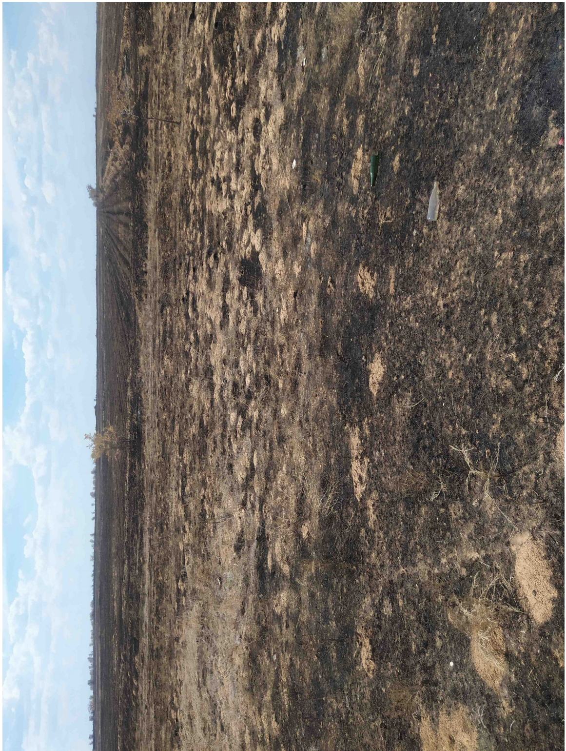
Фото сделано в точке с координатами N47° 57' 21.97" E46° 36' 35.73" , 22.07.2020 13:16:39 (МСК)