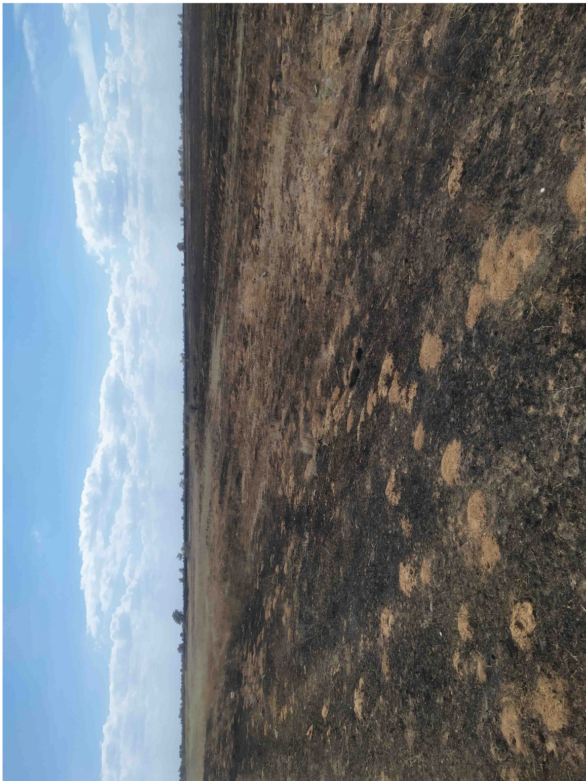
Фото сделано в точке с координатами N47° 57' 21.84" E46° 36' 35.7" , 22.07.2020 13:16:42 (МСК)